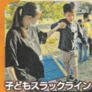
子どもスラックライン

子どもチャレンジコーナー スラックラインとモルックにチャレンジ 対象:小学生 参加費:200円 (おたのしみ券付)