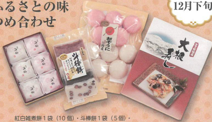
紅白雑煮餅1袋(10個)・斗棒餅1袋(5個)・大根寿し1箱・福梅1箱(6個)