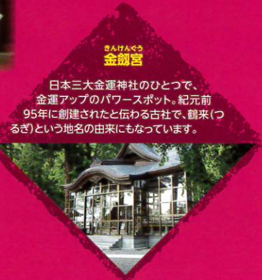
金劔宮 日本三大金運神社のひとつで、金運アップのパワースポット。紀元前95年に創建されたと伝わる古社で、鶴来(つるぎ)という地名の由来にもなっています。