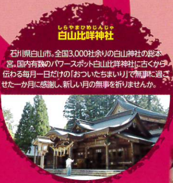
しらやまびまのじら 白山比咩神社 石川県白山市。全国3,000社余りの白山神社の総本宮。国内有数のパワースポット白山比咩神社に古くから伝わる毎月一日だけの「おついたちまいり」で無事に過ごせた一か月に感謝し、新しい月の無事を祈りませんか。